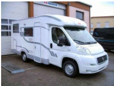
Adria 574 SP