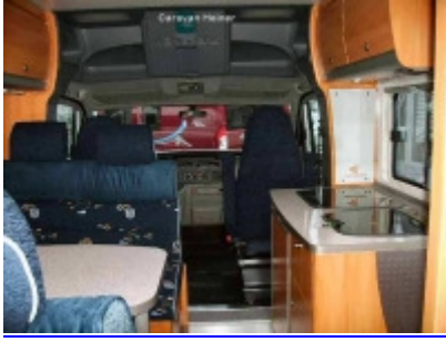
Blick nach vorne