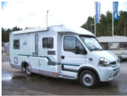
Imperiale 600 LD 2008