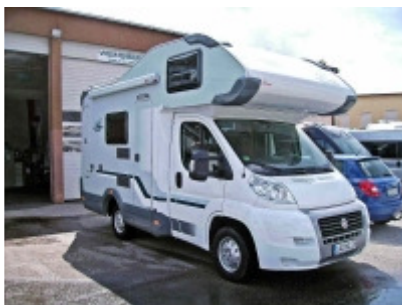
Orbiter 501 Klima