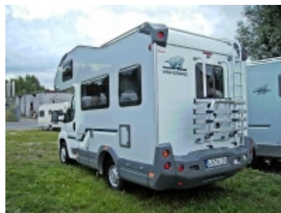
Weinsberg Orbiter 501