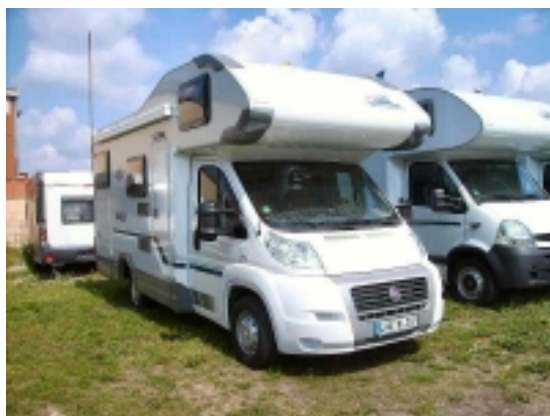
Orbiter G 631 Modell 2009