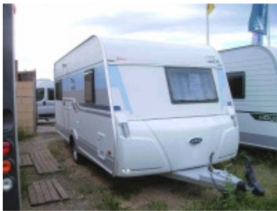
Wilk S 4 450 HTD